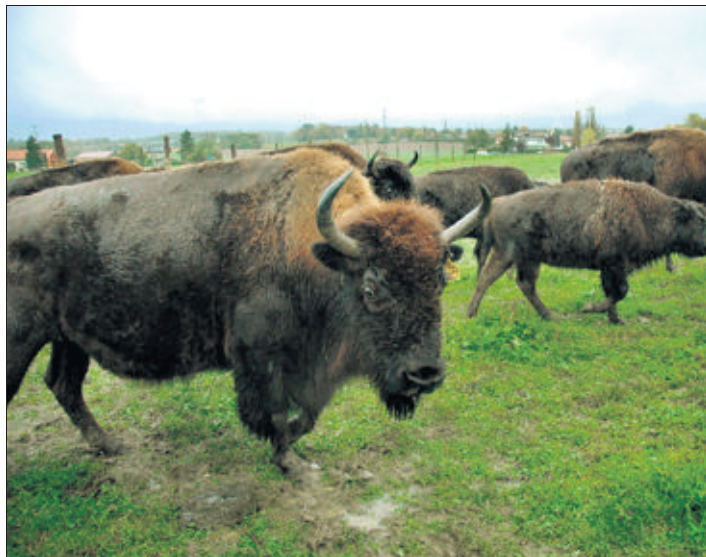
Les bisons de Colovrex. Ces ruminants qui paissent près de l'aéroport devront-ils céder leur place à des industries?