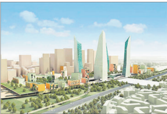
En hauteur. C'est le grand retour des tours. (ATELIER CHRISTIAN DE PORTZAMPARC/2009)