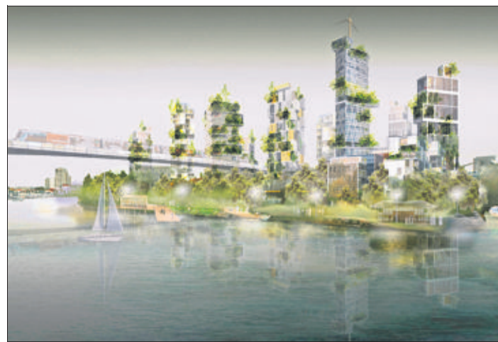
En banlieue. L'île de Vitry avec métro aérien. (ATELIER CASTRO DENISSOF/2009)