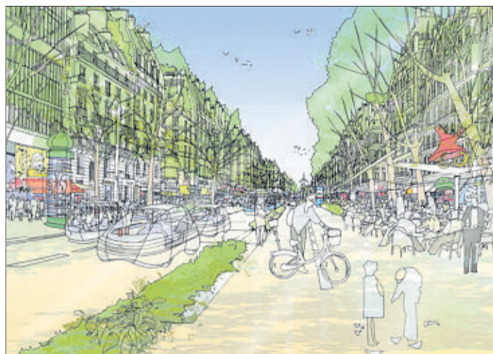
Qualité de vie. Les dix architectes veulent un Paris agréable à vivre pour ses habitants. (ROGERS STIRK HARBOUR & PARTNERS/2009)