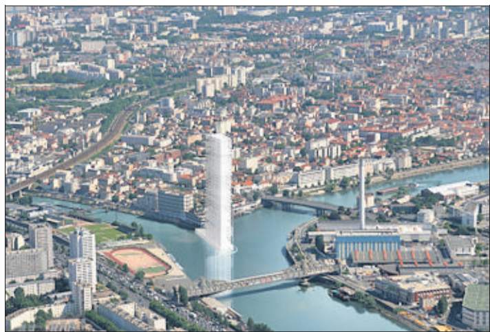
Densifier Paris. Au confluent de la Marne et de la Seine. (GROUPE DESCARTES, YVES LION/2009)