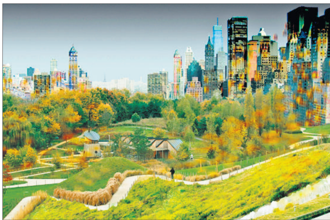
La ville à la campagne. Le parc de La Courneuve prend des allures de Central Park. (ATELIER CASTRO-DENISSOF/2009)

D'ailleurs, c'est sur ce plan-là que l'imagination éprouve bien du mal à se frayer un chemin vers le pouvoir. Entre le secrétaire d'État au Grand Paris, Christian Blanc, le maire de Paris, Bertrand Delanoë et le président de la région Ile-de-France, Jean-Paul Huchon, les batailles d'influence font rage et brouillent complètement cette réforme fondamentale.