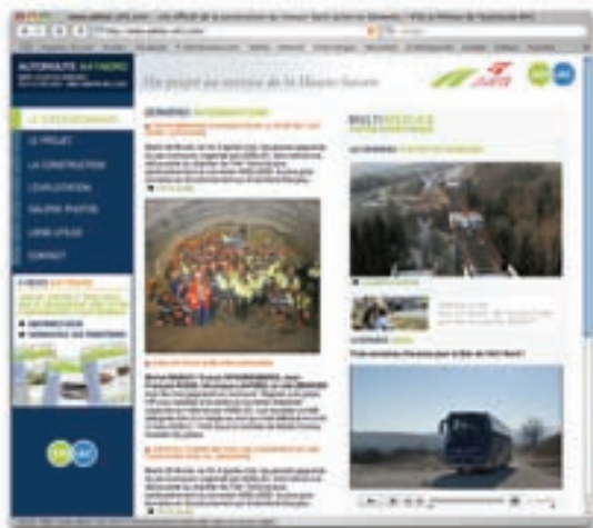
Le site www.adelac-a41.com a enregistré, en 2007, 57 000 visites.

Des opérations spécifiques pour les élèves des collèges du département ont, par ailleurs, été mises en place.