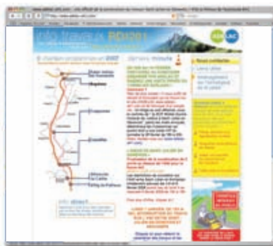
En 2007, le site a reçu 15 000 visites et compte 2 500 abonnés.

(ex RN201). Ce site informe systématiquement riverains et usagers de la route départementale des dates et horaires des restrictions de circulation et de leur nature. La mise en ligne de ces informations s'accompagne de l'envoi systématique d'une brève électronique à toutes les personnes désireuses de figurer sur la liste des destinataires. A ce jour, quelque 2 847 personnes reçoivent ces informations leur permettant de prendre leurs dispositions avant d'emprunter la RD1201. Le lancement du site www.rn201.com a fait l'objet d'une campagne de promotion visant, à l'aide d'affiches et d'une distribution massive de dépliants, à inviter les utilisateurs de cet axe à se reporter à cet outil d'information fiable et pratique. Le programme de travaux de 2007 a donné lieu à une réédition de cette opération de promotion.