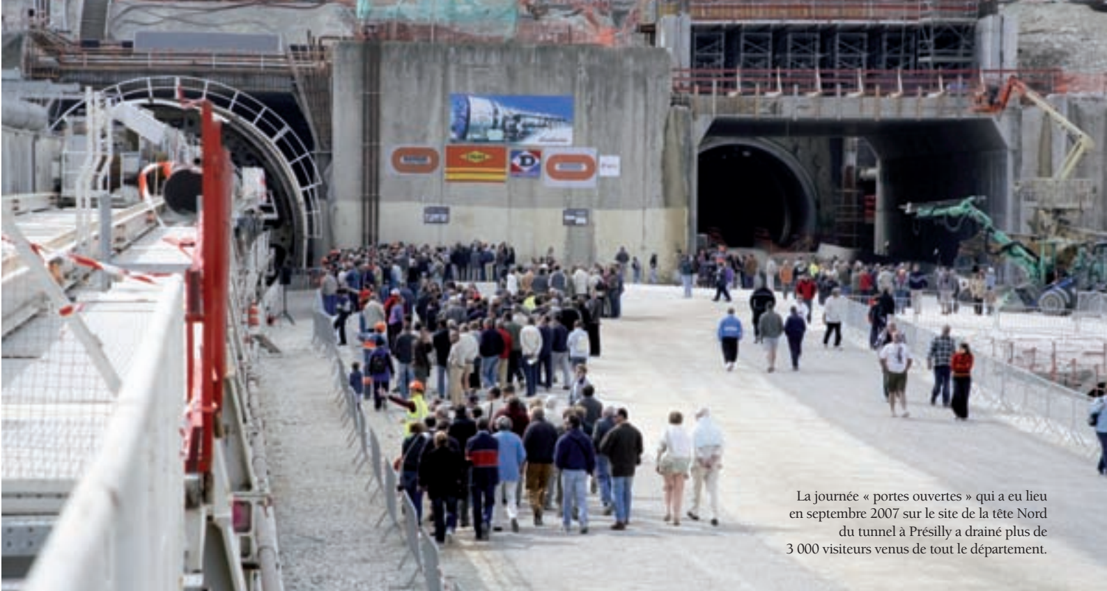
La journée « portes ouvertes » qui a eu lieu en septembre 2007 sur le site de la tête Nord du tunnel à Présilly a drainé plus de 3 000 visiteurs venus de tout le département.